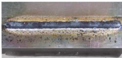
Standard CO 2 Spritzerbildung / Spatter: 13,30g/min

Beispiel: Überlappstoß, Blechdicke / Example: Overlap joint, sheet thickness 2x 2,3mm 90g Zn/m 2 , 220A, 0.5m/min